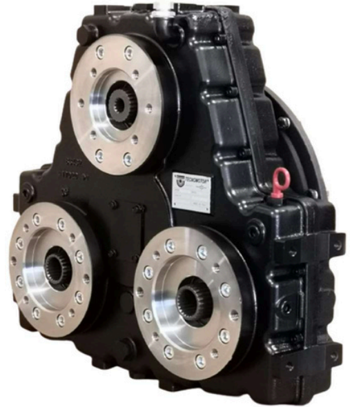
TMP 340 Dimensioni